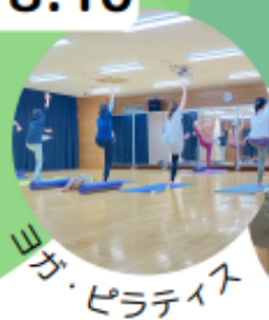
ヨガ・ピラティス